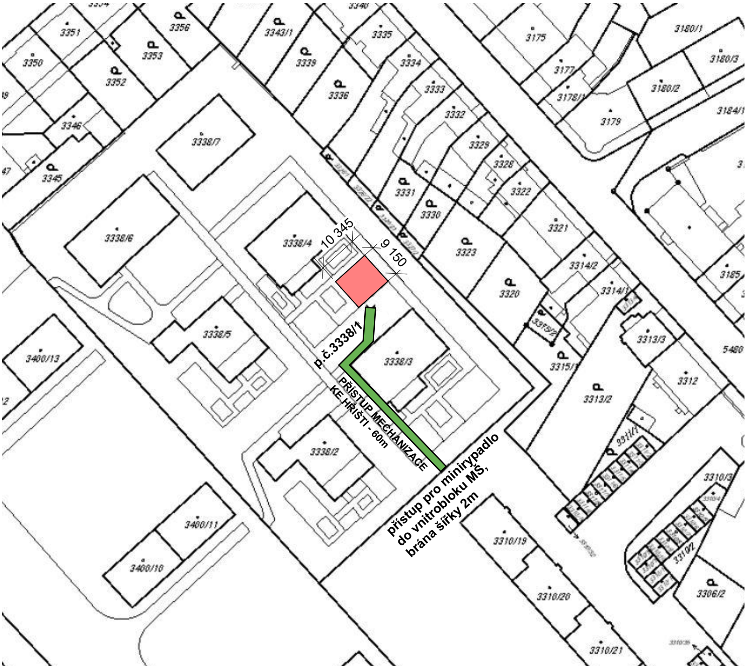
C.01SITUAČNÍ VÝKRES ŠIRŠÍCH VZTAHŮ C.02 CELKOVÝ SITUAČNÍ VÝKRES